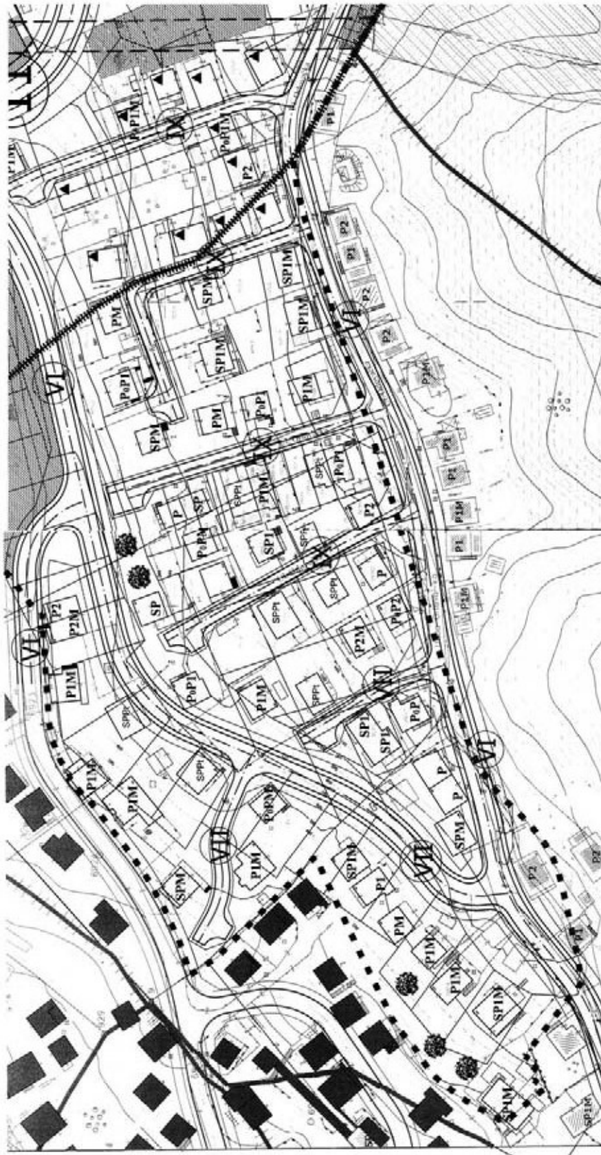
KOREKCIJA REGULACIONOG PLANA "POFALICI" Objekti u ulici Zahira Panjele