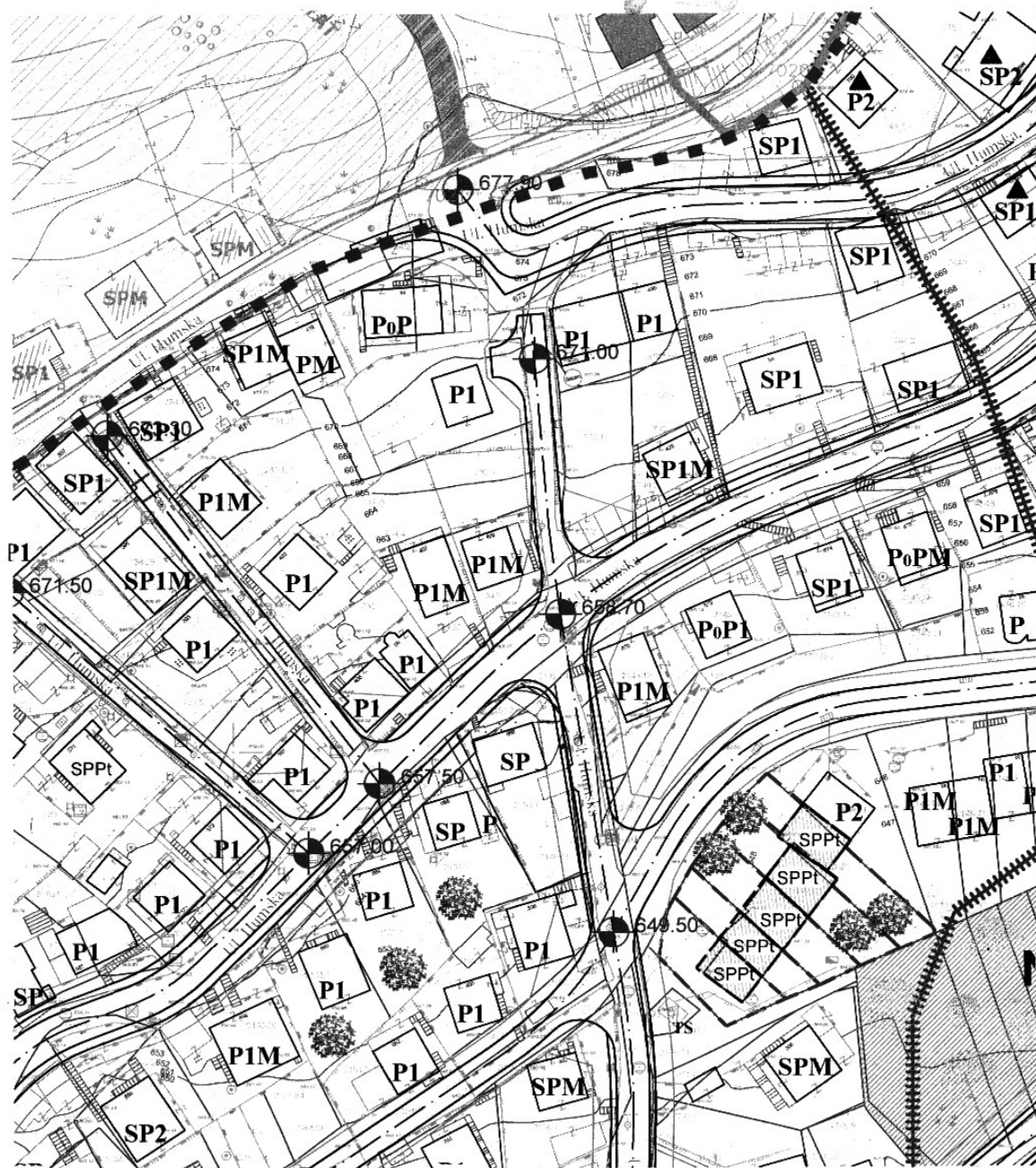
KOREKCIJA REGULACIONOG PLANA "POFALIĆI"