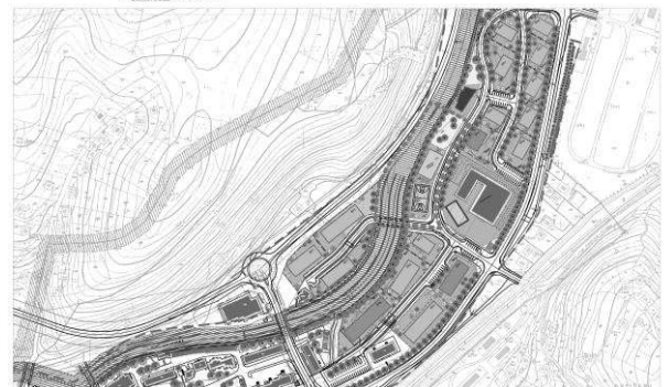
IZVOD IZ REGULACIONOG PLANA "HADŽIĆI", 1:2000 (“Službene novine Kantona Sarajevo” broj 09/14)

■■■■■■■■■■ GRANICA OBUHVATA Lokalitet 2: Građevinske parcele 'S8', 'S9' i 'S10' P obuhvata = 0,5 ha